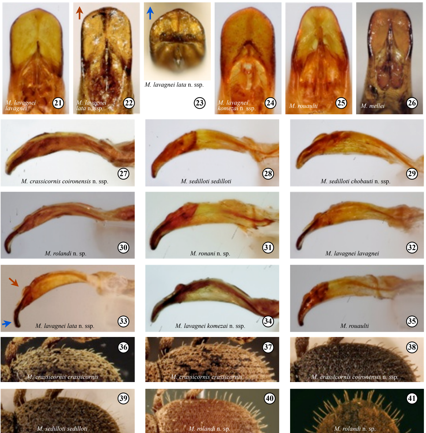
Fig. 21-26. - Edéages (vue dorsale). - 21: M. lavagnei lavagnei Pierotti & Bello, 1994, ♂, gorges du Rieutord, Sumène, Gard. - 22-23: M. lavagnei lata n. ssp., holotype ♂, monts de l'Espinouse, Hérault. - 24: M. lavagnei komezai n. ssp., holotype ♂, montagne de Nore, Tarn. - 25: M. rouaulti Pierotti, 2011, ♂, combe de Massillargue, Castillon-du-Gard, Gard. - 26: M. mellei Delaunay, 2011, ♂, Tanargue, Ardèche.